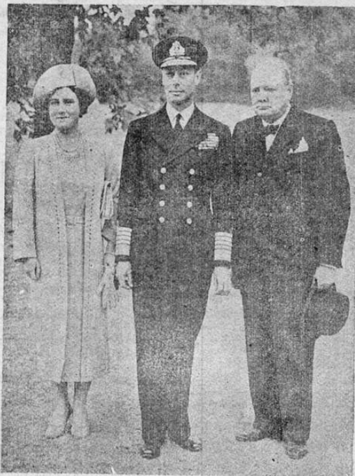
THEIR MAJESTIES AND MR. CHURCHILL

The bomber was hit by gunners manning a heavy gun site. Not many rounds had been fired before the bomber went out of range of the guns and began to lose height rapidly.