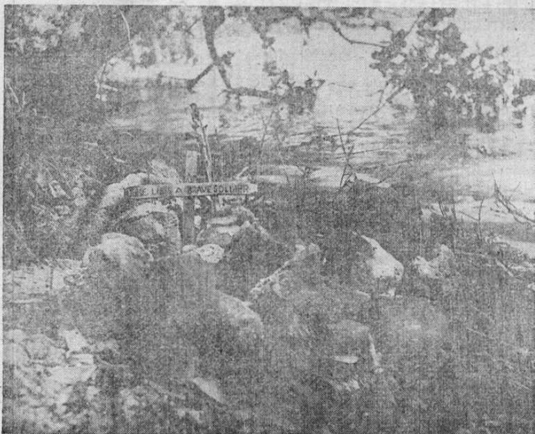
El impresionante y solemne espectáculo que ofrece la naturaleza en el lugar agreste en donde cayó y fué sepultado uno de los heroicos soldados norteamericanos que sucumbieron en la épica conquista de Guadalcanal. Su nombre es desconocido, pero su espíritu prode forma parte del alma los pueblos que combaten y combatirán por la libertad humana.