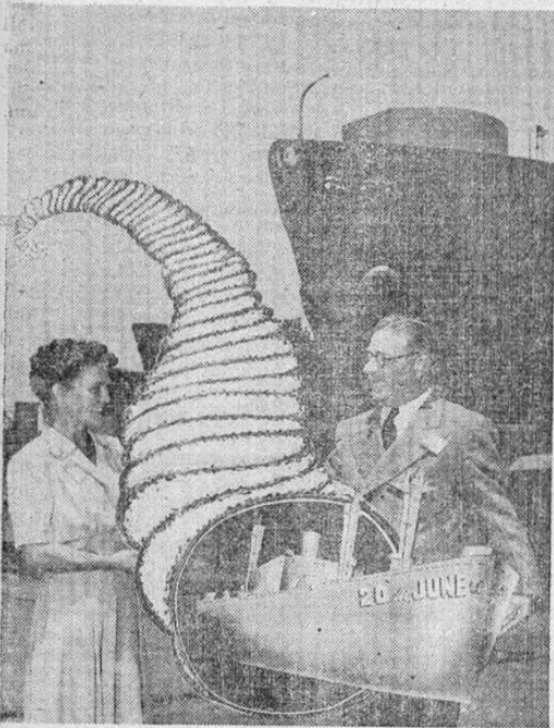
La presentación del simbólico cuerno de la abundancia a un astillero naval de los Estados Unidos que construyó veinte barcos durante el mes de junio; es decir, uno cada treinta y seis horas. Las construcciones norteamericanas de barcos han superado en los primeros seis meses de 1943 el total de todo el año de 1942.